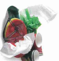
Vaisselle en plastique

Exemples de déchets à déposer en déchèterie ou auprès d'associations :