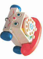
Jouets en plastique